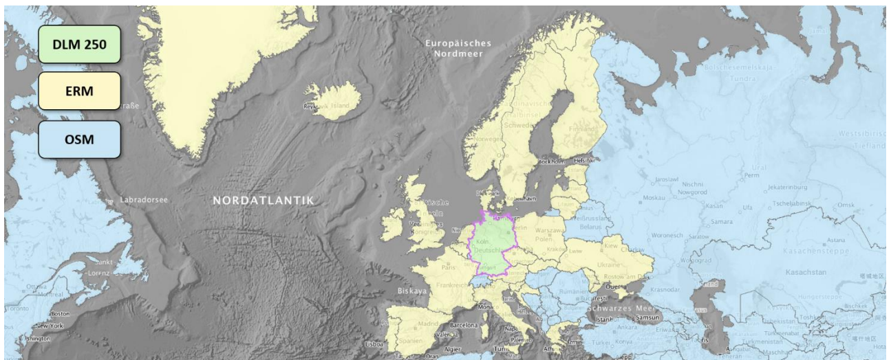
Abbildung 2 - Hauptdatengrundlagen mittlere Zoomstufen (1:100.000 - 1:250.000)